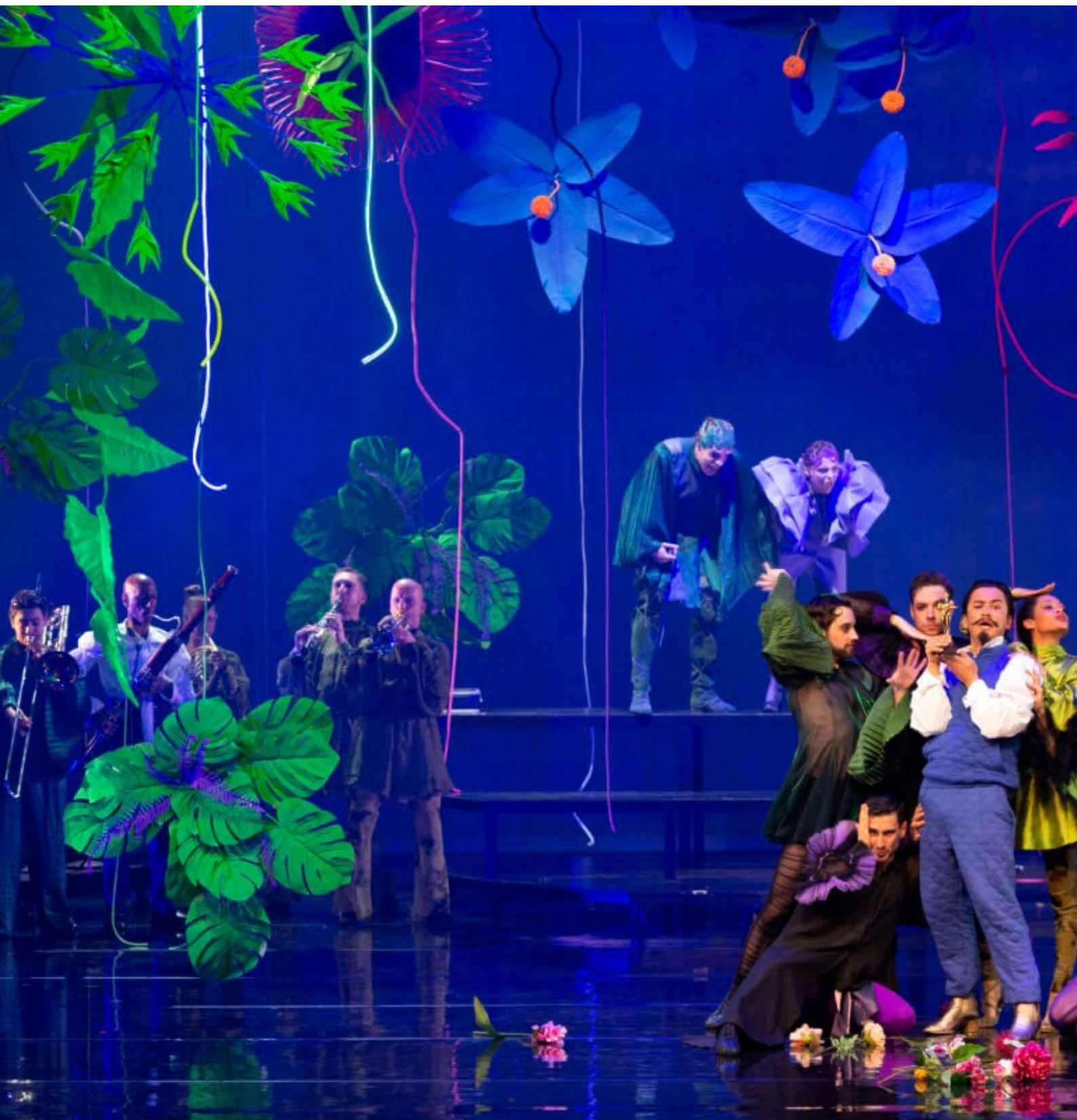
Midzomernachtsdroom van Theater Oostpool, PHION en Introdans in de regie van Daria Bukvić